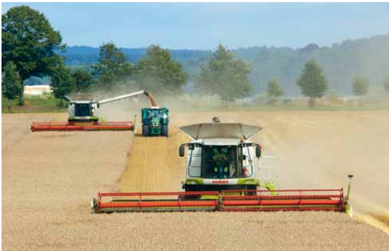
Trots att årets spannmålsskörd inte nådde 2009 års volymer, blev lönsamheten god med relativt sett höga priser under hösten.