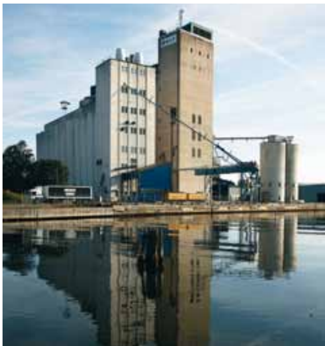
KLF investerade i en ny intagningshall vid anläggningen i Åhus.