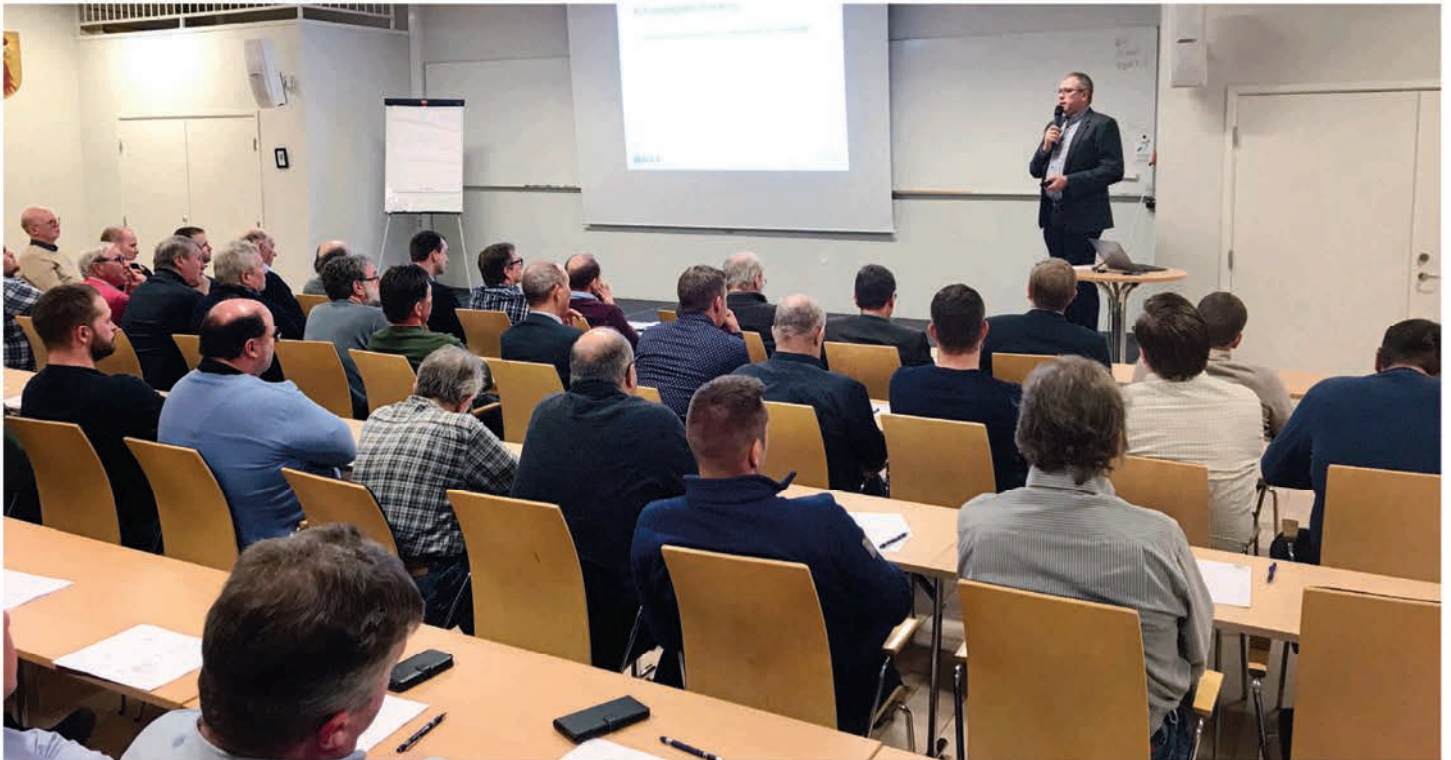
Stor uppslutning på KLF:s medlemsdialog.

STYRELSENS INITIATIV ATT SKAPA ETT FORUM FÖR ATT VENTILERA STÖRRE FRÅGOR SOM RÖR FÖRENINGENS FRAMTID, MEDLEMSDIALOGEN, SOM STARTADE 2018 HAR VARIT MYCKET UPPSKATTAD. DET ÄR TYDLIGT ATT MEDLEMMARNA ÄR ENGAGERADE I KLF:S VERKSAMHET OCH GÄRNA DISKUTERAR DEN. EN AV DE FRÅGOR SOM LYFTES PÅ DET FÖRSTA MÖTET VAR FRÅGAN OM MEDLEMSKAPET OCH STYRELSEN FICK I UPPDRAG ATT UTREDA ETT EVENTUELLT VIDGANDE AV MEDLEMSVILLKOREN. I VINTRAS GENOMFÖRDES EN NY SAMMANKOMST OCH ARBETET HAR TAGIT YTTERLIGARE ETT STEG FRAMÅT.